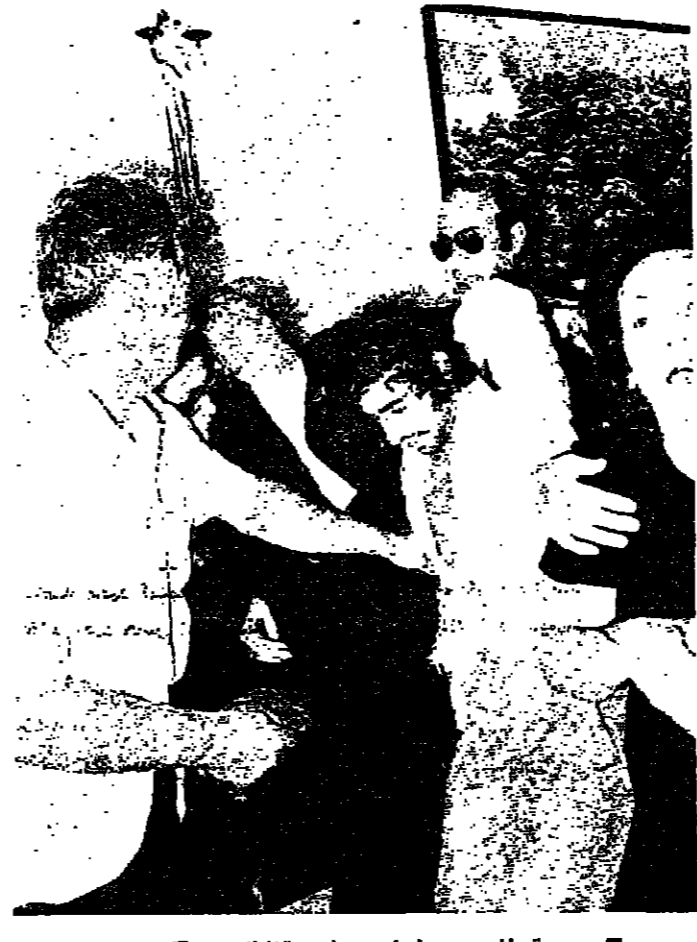
سيدة اغسي عليها من شدة الحزن

كتب نزيه نقوزي : استشهد ٤ ضباط لبنانيين ، و ١٤ من الجنود ، وجرح ٤٢ آخرون ، في الاعتداءات الاسرائيلية على ثكنة صور ومخيمات البص والبرغلية وبرج رحال امس . وقد دبرت تقابل العدو ، من البر والبحر والجو ، عشرات المساريل والاكواخ في مخيم البرغلية .. وعلى كل اعتداء كان الرد عنيفاً ، من قسبل الجيش والقوية ، وكبهد العدو خسائر في الارواح . والاعتداءات حصلت على مرحلتين ، الاولى بدأت في الواحدة والنقبة . ٥ نجر امس ، عندما تسفلت قسوة « كورندوس » للعدو ، قدرت بـ ٢٠٠ جندي الى شاطي البص ، وانخذت من مركز مصلحة كورباده لبنان عد . مدخل المخيم الغربي مركزاً لنا . تمركز .. وقصفوا